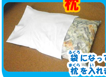
ふくろ袋になっているので横からまくら枕を入れます