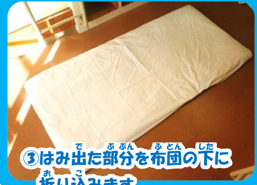
③ はみ出た部分を布団の下に折り込みます