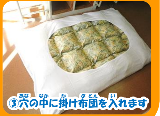
③ 穴の中に掛け布団を入れます