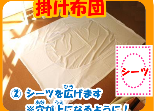
② シーツを広げます