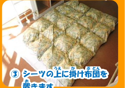
③ シーツの上に掛け布団を置きます