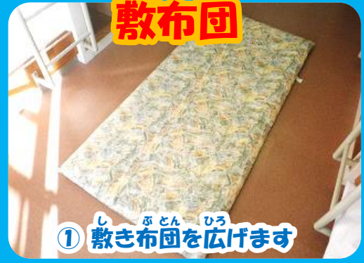
① 敷き布団を広げます