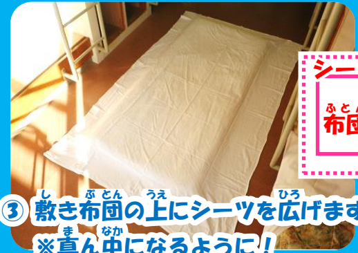
③ 敷き布団の上にシーツを広げます ※真ん中になるように!