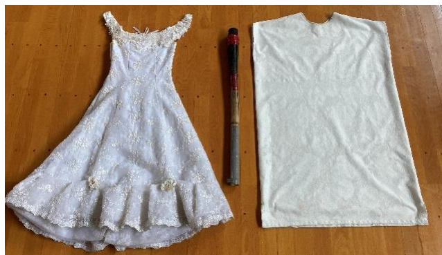
火の神の衣装(2種類 フリーサイズ)