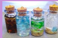
海のボトルチャーム 1,000円(税込)