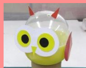
おきあがりフクロウ 300円(税込)