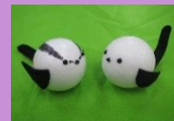
マイ・エナガ工作 800円(税込)