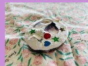
ホンビノスガイのコースター 800円(税込)