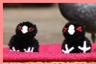
オオバンの鏡餅 600円(税込)