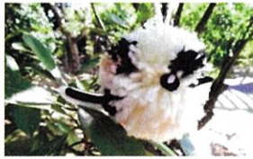
小鳥の毛糸ぼんぼん700円