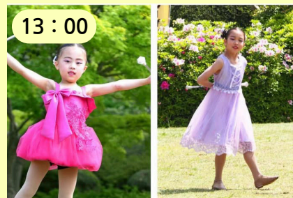
Kana Baton Team