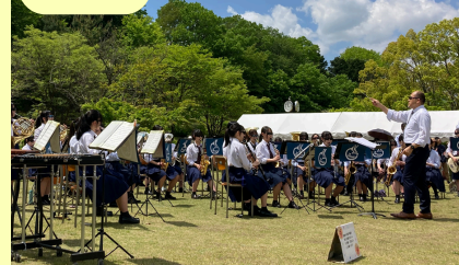
東大津高校吹奏楽部