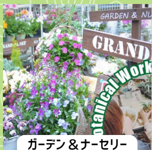
ガーデン&ナーセリー GRANDPA