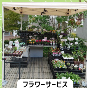
フラワーサービス 木の岡