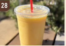
28 ニコマル ミックスジュース 400 円～