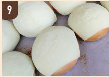
9 スイーツランド・アサリッチ 富良野メロンパン 240 円