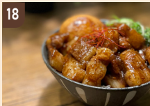
18 華麗なるスパイスカレー 大阪産なにわポークの 魯肉飯カレー 1,200 円