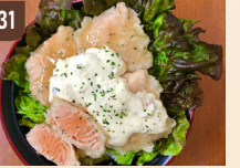
31 ナカタノサカナ サーモントル南蛮丼 1,200 円