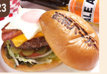
23 高槻バーガー(T's★Diner) 高槻バーガースペシャル 1,300 円