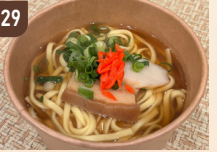
29 びないさーら 沖縄そば 1,100 円