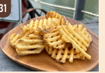
31 POTALU ワッフルポテト 800 円