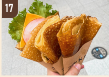
17 コフレディエ 濃厚バターシュガー 600 円