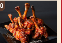
30 世界の山ちゃん 幻のチューリップ 800 円