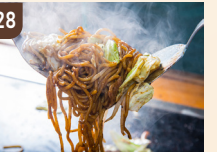
28 KAIBUTSUDO 大阪なにわ焼きそば 800 円