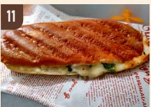
11 BAMBY CAFE パニーニセット 1,100 円