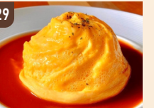
29 とっとのレシビ とっとのドレストオムライス 800 円