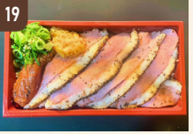
19 兆究 鴨ロース丼 1,000 円