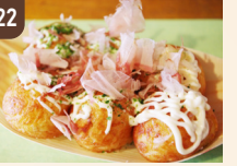
22 鉄板番長カナルくん 伊賀醤油たこ焼き 700 円