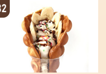
32 pokopokowaffle バブルワッフル 800 円