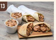
13 KEBAB TIME ケバブ 800 円