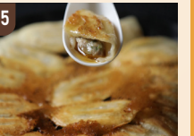
25 じいじの餃子 小籠包餃子 700 円