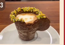
33 RJ Coffee Roasters エコプレス 500 円～