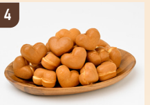
4 スターキッチン ベビーハートカステラ 1,000 円