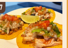
17 LOCO TACOS TACOS 3P SET 1,500 円