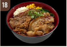
18 肉の天保堂 黒毛和牛と十勝風豚丼の 贅沢丼 1,200 円