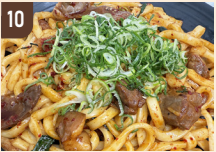
10 キッチンふーたん ホルモン焼うどん 800 円