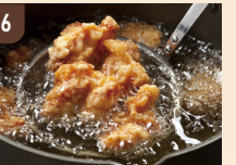
6 北海道フード 北海道ザンギ 800 円