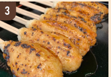
3 はぢめちゃん号 五平餅 300 円