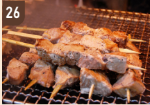
26 WIND Street Foods 焼きマグロ 700 円