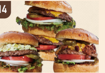
14 K's Pit リアルアメリカンバーガー 1,200 円