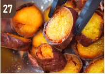
27 ばくまい。 塩バター揚げ焼き芋 600 円