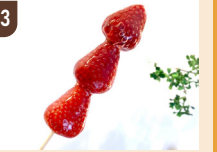
33 cafe siesta 季節のフルーツあめ 600 円～