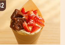
32 YOU CAN クレープ 800 円