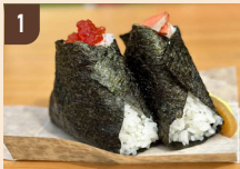
1 日本の心 おむすび おむすび 400 円～