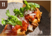
11 京タコス ブルーコーン タコス 800 円