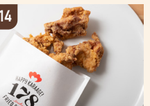
14 からあげ 178 オリジナルからあげ 700 円