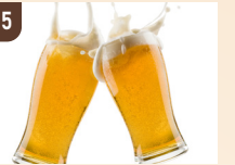
15 Q's Beer Caravan 生ビール 700 円～