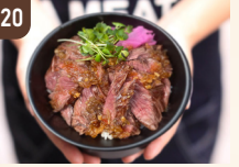
20 WALT 熟成牛ハラミステーキ 1,500 円