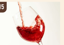
15 BAR WISTERIA ホットワイン 700 円