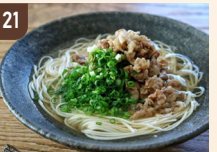
21 ふくら手延へ製麺所 淡路牛の肉にゅうめん 900 円