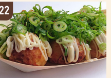
22 咲たこ 京風たこ焼き 750 円