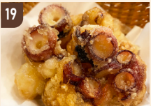
19 北礼商店 タコザンギ 800 円～