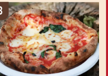
8 PIZZA ROTOLO マルゲリータ 1,000 円