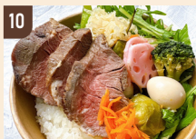
10 Hometown フレンチ幕の内 1,200 円