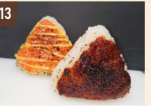
13 晴レルヤKitchen おむすび 350 円～