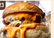
23 BURGER SUEO 濃厚チーズバーガー 1,300 円