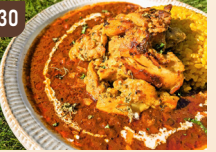
30 無農薬玄米カレーコブカフェ 若鶏もも肉のタンドリチキン ごろごろカレー 1,500 円