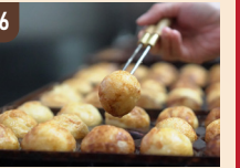
16 FOOD TRUCK ひなた たこやき 650 円