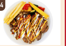
24 JANGOOD SPICE ニューヨークチキンオーバーライス 1,500 円