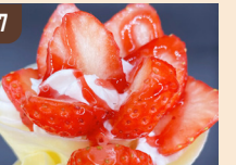
7 Le cocon もちもちクレープ 650 円