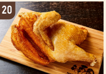
20 なるとキッチン 若鶏半身揚げ 1,300 円