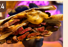
24 YAMA BAL チーズステーキサンド 1,500 円