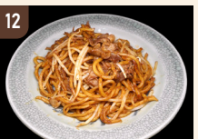
12 石修堂 なみえ焼きそば 800 円