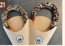
21 Well Cafe 米粉チュロス 600 円～