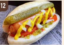
12 ソライロカフェ シカゴドッグ 700 円