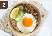
2 彩 ～color～ ガバオライス 1,000 円