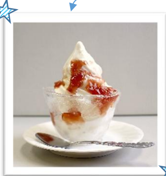
④⑥みずの森オリジナル フラワーソフト ¥600