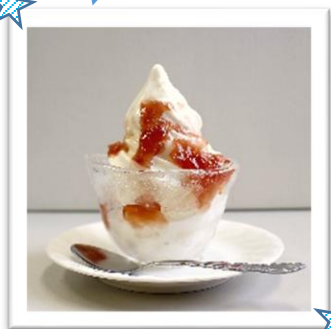
⑳みずの森オリジナル フラワーソフト ¥600