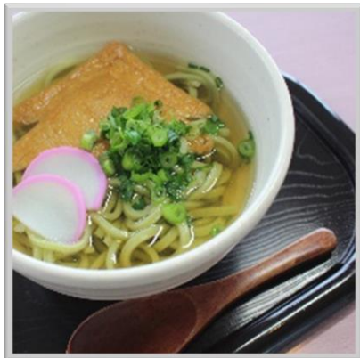
①蓮うどん ¥750 (税込)