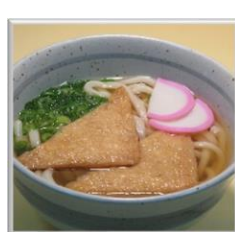
⑬きつねうどん (単品) ¥600 (税込)