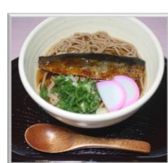
⑰にしんそば ¥700 (税込)