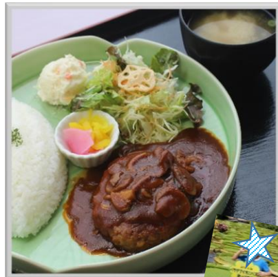
⑥オニバスランチ デミグラスハンバーグ (味噌汁付) ¥900 (税込)