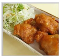
③⑩ 唐揚げ ¥450 (税込)