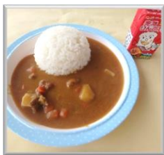
②④ お子さまカレー ¥500 (税込)