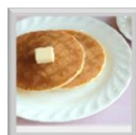
③⑧ ホットケーキ ¥500 (税込)