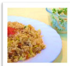
⑦チャーハン ¥700 (税込)