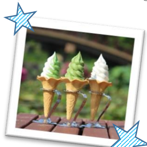
④⑥⑦ ソフトクリーム ¥400 (税込) (ハス・ミックス・バニラ)