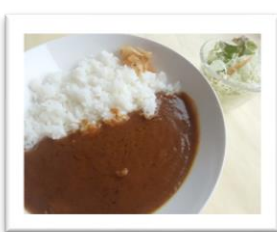
⑧ビーフカレー ¥700 (税込)