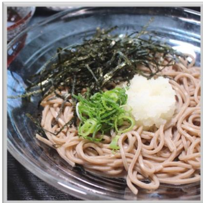
②冷やしおろしそば ¥600 (税込)