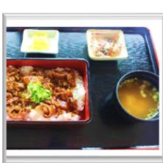
⑩牛カルビ焼肉重 (味噌汁付) ¥960 (税込)