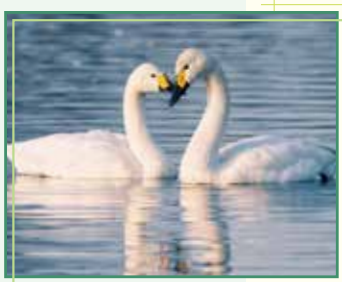
「コハクチョウと仲間たち」