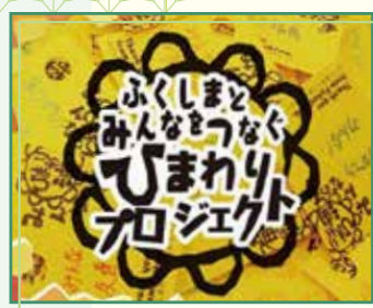
「ひまわりフェスタ」