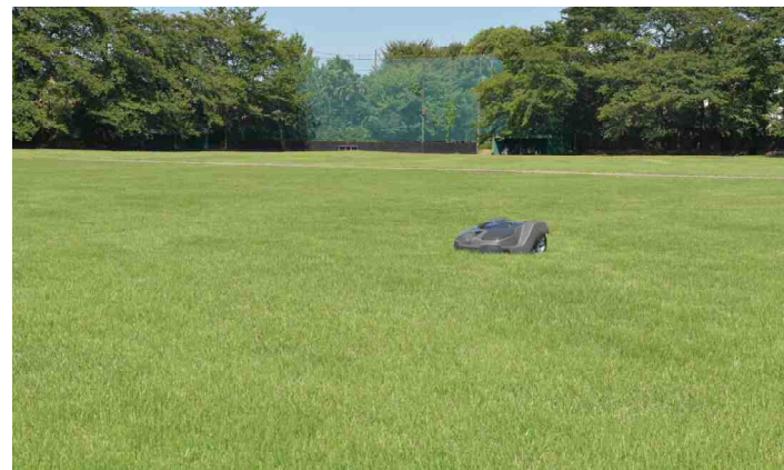
丸井研修センター (グラウンド)