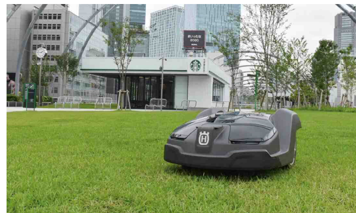
渋谷区立宮下公園