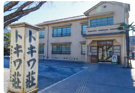
▲豊島区立トキワ荘マンガミュージアム

マンガ・アニメの原点「トキワ荘」があったことで、マンガ・アニメ・コスプレの聖地として注目を集めています。「乙女ロード」をはじめとするポップカルチャーの発信拠点が続々と誕生し、国内外のアニメ好きが集まる街になりました。街全体で楽しめる、充実したイベントが毎年開催されています。