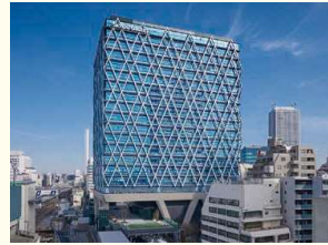
▲ダイヤゲート池袋

私たちは、植物を取り扱い、みどりが溢れる快適な空間づくり、育てる「造園業」の会社です。公園、住宅、ビルなど、さまざまな施設にみどりを増やし、人の暮らしにも環境にもやさしい街づくりを進めています。西武グループの一員で、計画・設計から工事、完成後の管理や運営まで一貫して行うことができる「みどりの総合プロデュース」が特徴です。これからも、豊かなみどりを育てて都市の環境を整え、人とみどりの豊かな暮らしをサポートしていきます。