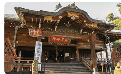
▲雑司ヶ谷鬼子母神

子育て・安産の神として幅広く信仰された鬼子母神は、国の重要文化財に指定されています。伝統行事「雑司ヶ谷鬼子母神御会式」は、白和紙の花を一面に付けた万灯をかかげて、団扇太鼓を叩きながら鬼子母神まで練り歩きます。