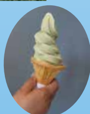
植物園推薦的 蓮霜其林

草津市立水生植物園水之森 (指定管理者:近江鐵道YOU group) TEL 077-568-2332